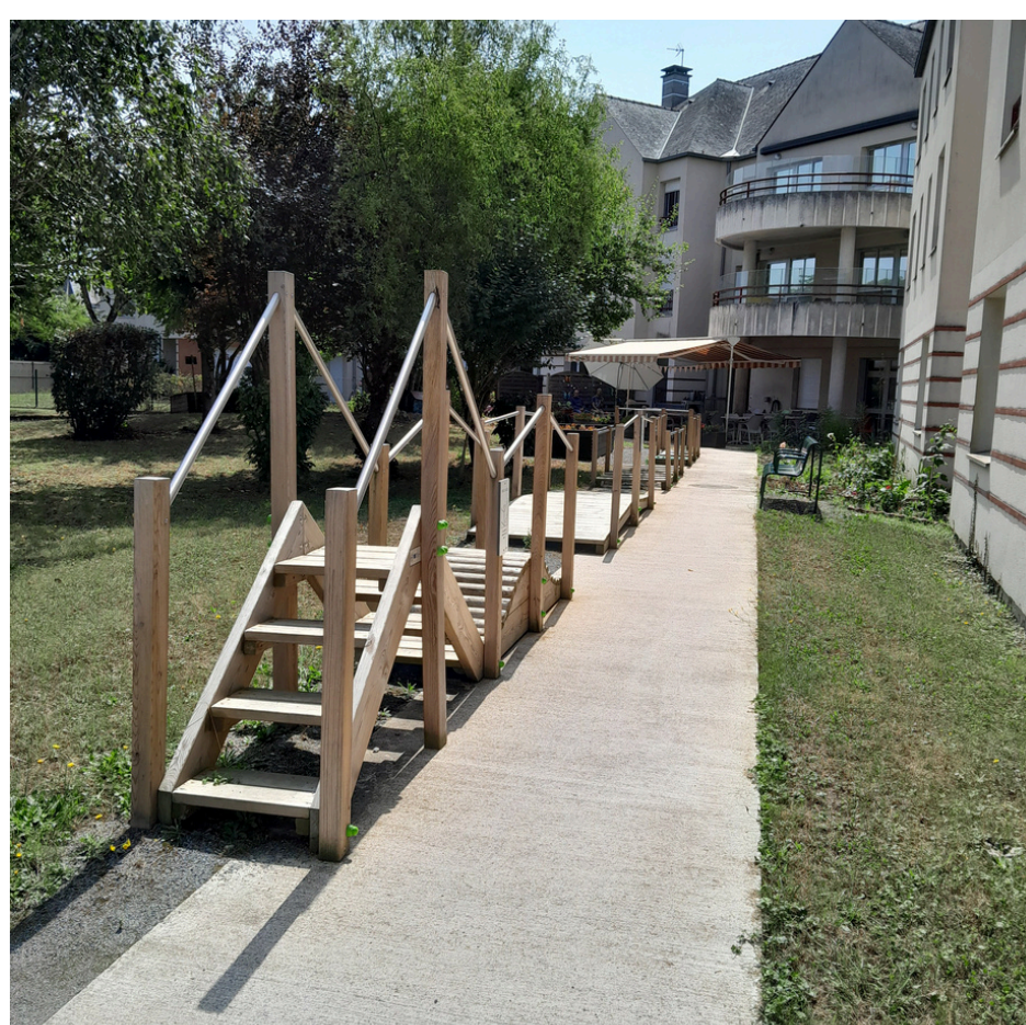
PARCOURS DE MARCHE